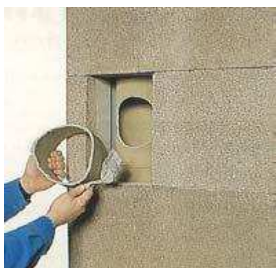
10. Mindkét ragasztási felület megnedvesítése után hézagkittet hordunk fel a füstcsőkarima peremére.