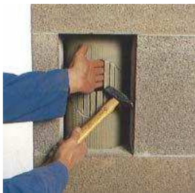
7. A kerámiacső darabokat óvatosan eltávolítjuk