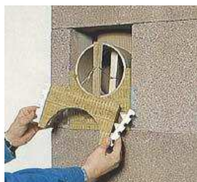
12. Felhelyezzük az előlapot.