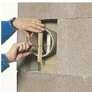
11. A füstcsőkarimát a kerámia csőhöz csavart huzallal rögzítjük.