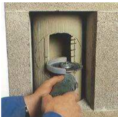
8. A megmaradt oldalsó részeket csikokban bevágjuk.